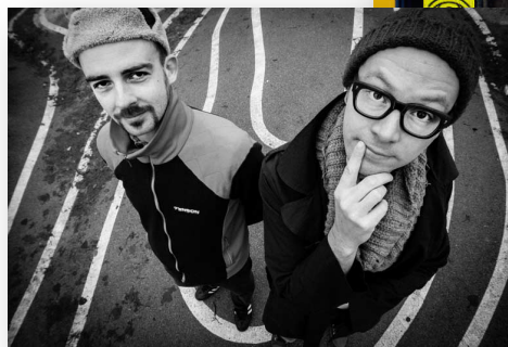
Psycho & Plastic